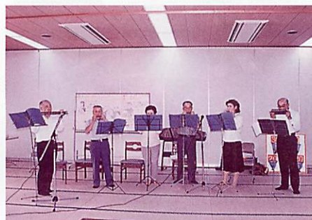
▲こちらも常連旧森荒木さんひきいるハーモニカクラブによる演奏