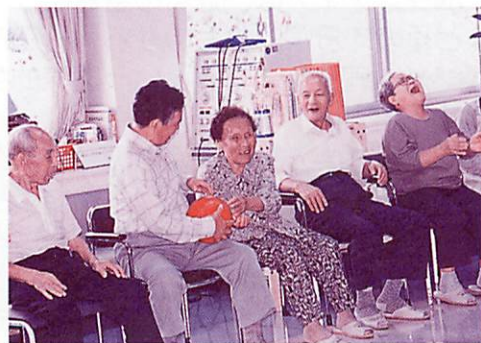
▲毎年行っている玖珠園サービスとの交流会