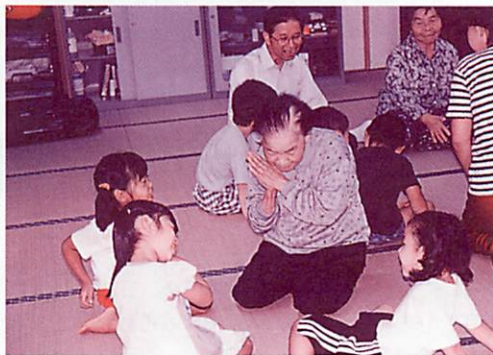
◀杉の子保育園の約20名の子供たちは上手に手話コーラスをひろうしたり、おじいちゃん・おばあちゃんとのゲームをしたり…と元気いっぱい交流会にしてくれました。