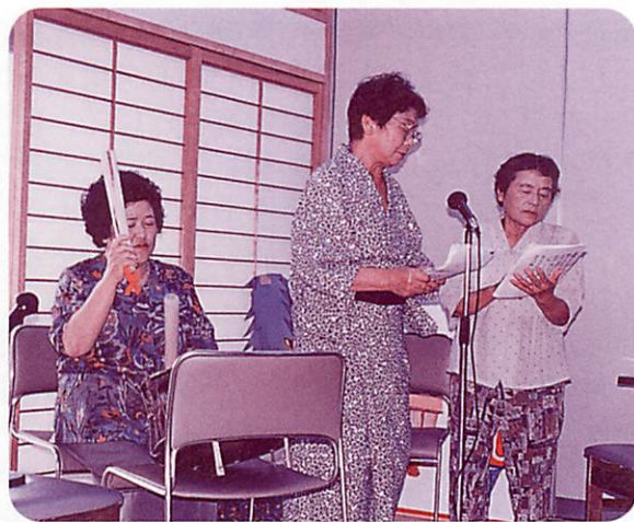
▲歌でも太鼓でも踊りでも何でもこいとにかく役者ぞろいの八幡婦人会の方々。