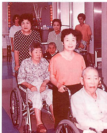
▲特別養護老人ホーム玖珠園での実習

要するに、老いても障害を持って、すべての人が生きがいと豊かな心を持って、安心して暮らしていけるために、地域を挙げてボランティア精神の高揚に努めなければならないと思います。