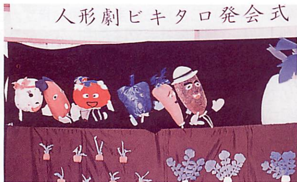
人形劇ビキタロ発会式