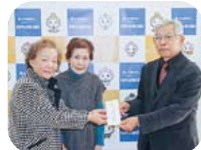
玖珠郡更生保護女性会様

お寄せいただきました募金は年内のうちに、民生児童委員を通じて必要な世帯にお渡しいたしました。皆さまからの温かいお気持ちに心よりお礼申し上げます。