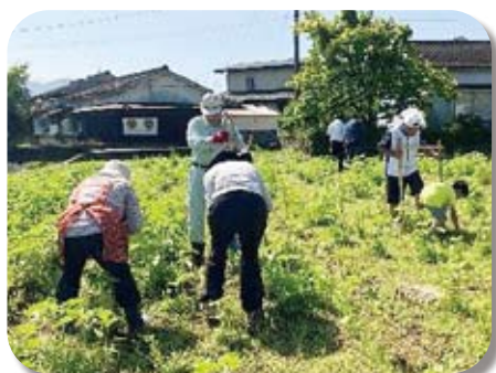
中塚脇いきいきサロン