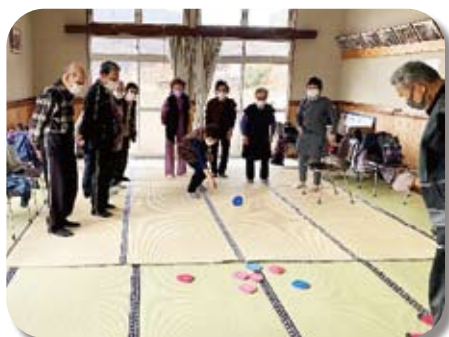
若返りサロン（魚返）