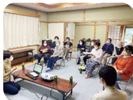
サロン・パンジー（たかず）