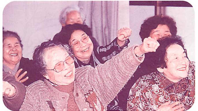
▲ひとり暮らしや家にとじこもりがちなお年寄りなどの 仲間づくりの場、“ふれあいいきいきサロン”。

八幡地区に続いて2番目の地区社協に。 これから♪格子を開ければ顔なじみ… 助けられたり助けたり♪を生かした活動 を推進します。