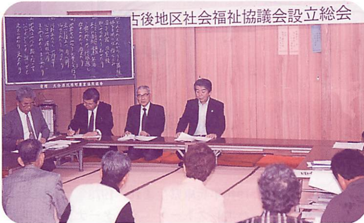
古後地区社会福祉協議会設立総会

発行：社会福祉法人 玖珠町社会福祉協議会 TEL 2-5513 FAX 2-2816 大分県玖珠郡玖珠町大字岩室24番地の1 (老人福祉センター内)