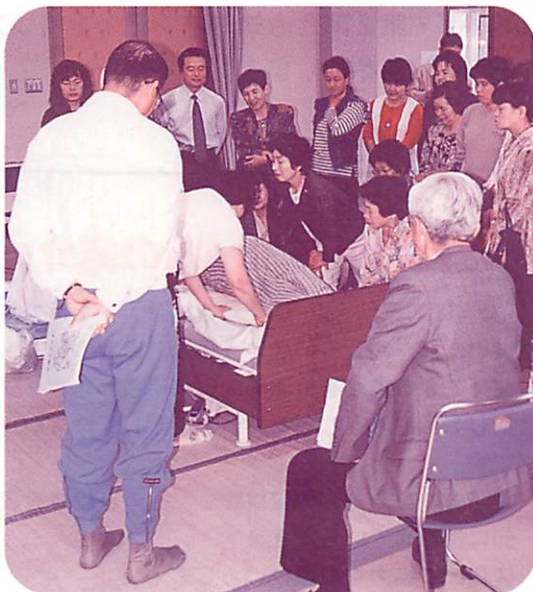
▲介護講習会など、その地域の必要に 応じた福祉講座を開催。

6月26日(土)に古後地区社協が発足しました。 ふれあいのある地域づくりを目指して、 これから