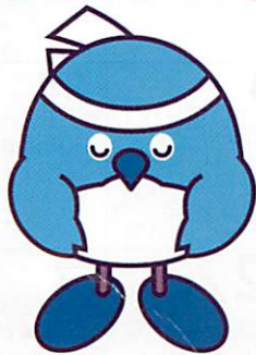
おおいた国体マスコットキャラクター「めじろん」