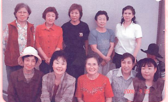
(まかせて会員の皆さん)