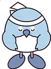
おおいた国体マスコットキャラクター「めじろん」