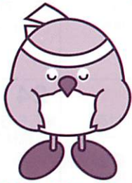
おおいた国体マスコットキャラクター 「めじろん」