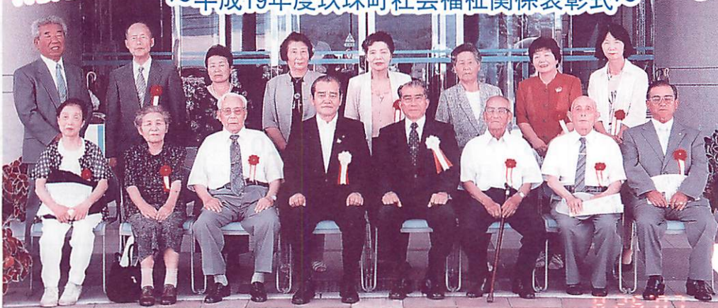
表彰式に出席された 皆さんによる記念撮影