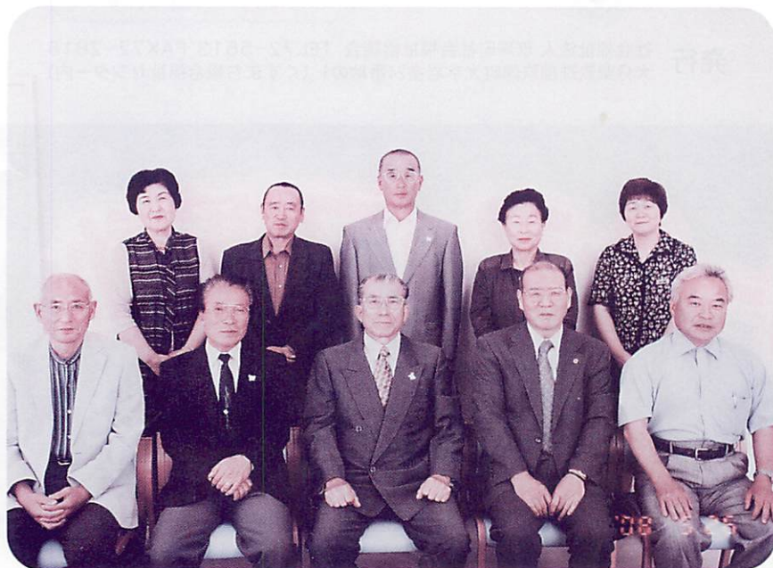
理事の皆さん、よろしくお願いいたします。

玖珠町社会福祉協議会では、5月に開催いたしました役員会において、任期満了に伴う役員改選を行いました。