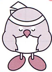
おおいた国体マスコットキャラクター「めじろん」