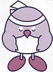
おおいた国体マスコットキャラクター 「めじろん」