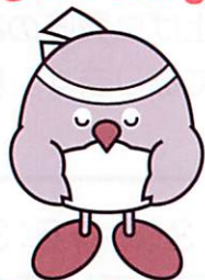
おおいた国体マスコットキャラクター「めじろん」